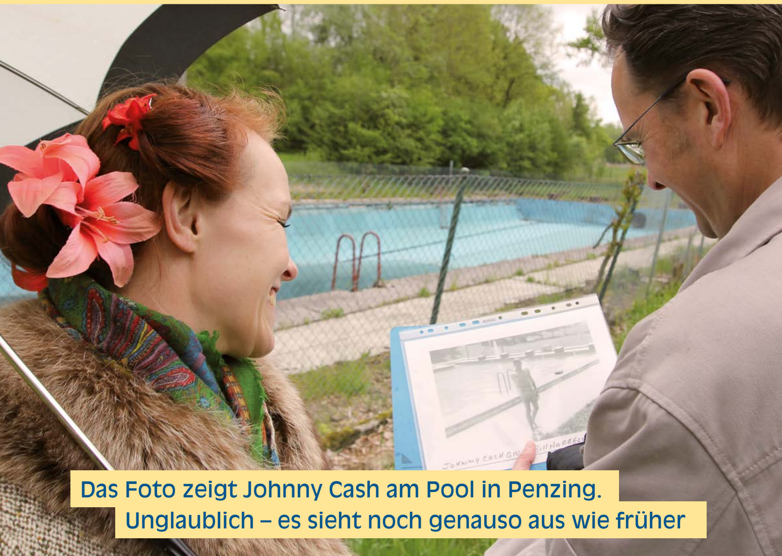
Das Foto zeigt Johnny Cash am Pool in Penzing. Unglaublich – es sieht noch genauso aus wie früher

In der Kaserne hatte er viel Zeit Gitarre zu üben und mit seinen Kameraden zu musizieren. In Penzing fasste er den Entschluss, sein Leben vollkommen der Musik zu widmen ★