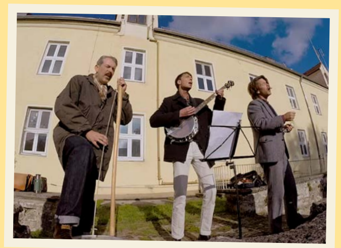
Der „Oktober Folk Club“ spielt die frühe „Popmusik“ – die Songs aus Zeiten von Jimmy Rogers und der Carter Family ★