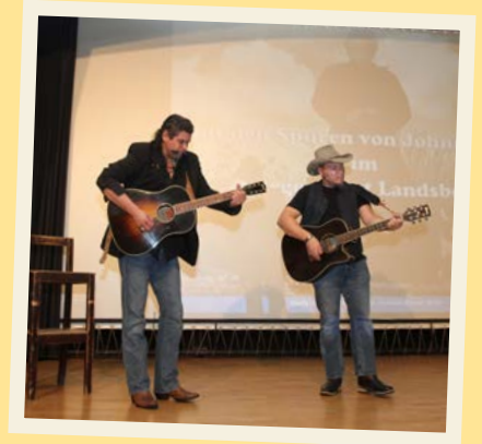
Die „Folsom Prison Band“ – sie hatten die große Ehre den „Folsom Prison Blues“ am 14. Oktober 2017 im Soldatenkino zu spielen. Hier hatte Johnny Cash genau 66 Jahre (und einen Tag) zuvor den Gefängnisfilm „Inside the walls of Folsom Prison“ gesehen ★